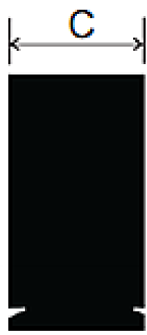
MEDIDAS EN CENTIMETROS